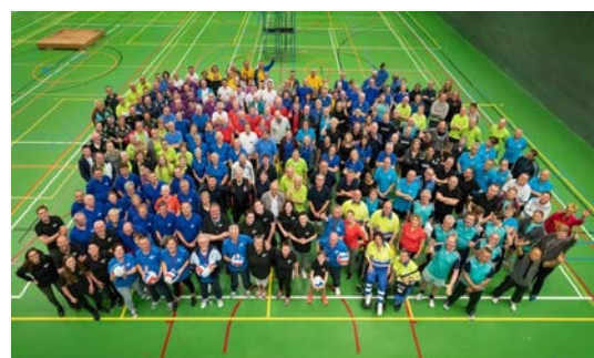
15 jaar Bechterew Volleybaltoernooi 2018

Stichting Bechterew is er ook dit jaar weer in geslaagd om een internationaal volleybaltoernooi te organiseren. Met de 15 e editie was 2018 was een jubileumtoernooi. Uiteraard heeft de stichting weer enorm haar best gedaan om er een geslaagd en gezellig evenement van te maken, daarvoor dank.